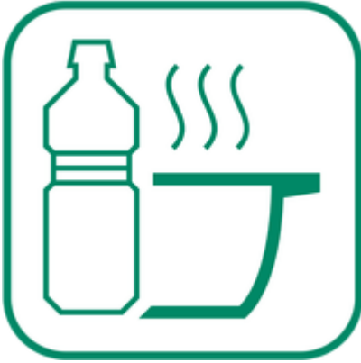
Huiles de friture