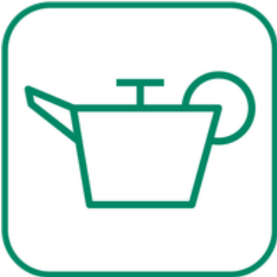
Huiles de vidange