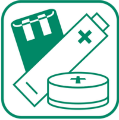
Piles et accumulateurs